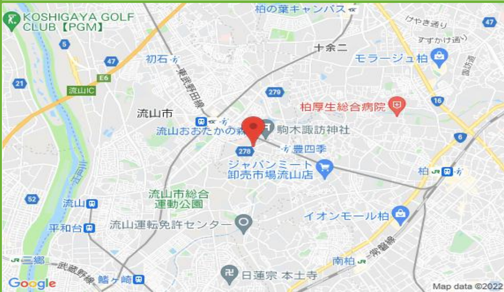
ヤマセ駐車場配置図

保管場所承諾証 保管場所承諾証が必要な場合は発行手数料といたしまして1台につき2,000円の手数料がかかります。