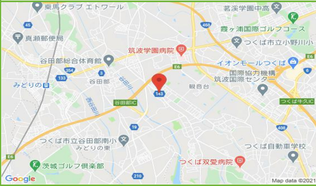
羽成駐車場 配置図

この物件の詳細は https://www.katsurafudosan.jp/search/parking_details_32